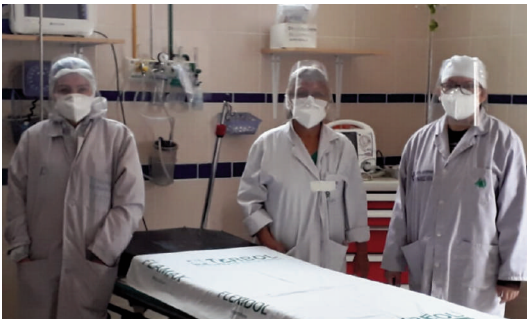
Personal sanitario del Hospital Hernández Vera en Santa Cruz de la Sierra, Bolivia

El número de casos confirmados de coronavirus en Bolivia asciende a 144.147 a día 24 de noviembre, según los datos recabados por la Universidad John Hopkins, y un total de 8.928 personas han perdido la vida por culpa de la enfermedad desde el inicio de la pandemia de acuerdo a la misma fuente, siendo Santa Cruz de la Sierra la región que presenta más de la mitad de los casos confirmados de COVID-19 en el país.