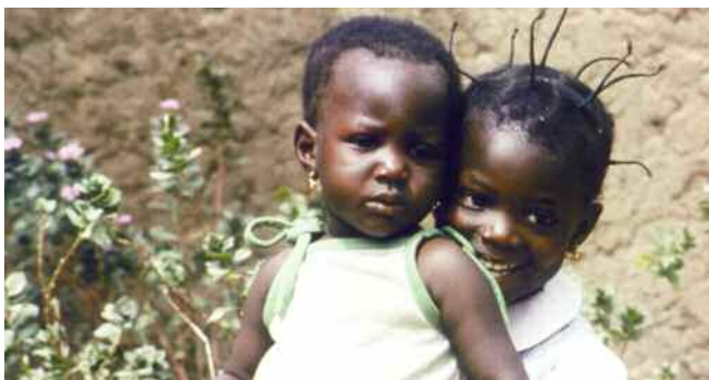
Niñas de Ruanda. ]

medicusmundi bizkaian egun lan handiagoa egiten dugun pertsonentzat garrantzitsuena eta pozgarriena da 50 urte igaro direla eta oraindik gure proiektuarekin ilusioa sortzen dugula pertsonengan, baita pertsonen lehentasuna izango duten eredurantz aldatzeko lan egiteko aukera izatea ere.