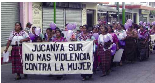
Manifestación contra la violencia hacia las mujeres en Guatemala. ]

Lo verdaderamente importante y gratificante para las personas que actualmente estamos más en activo en medicusmundi bizkaia , es que después de 50 años sigamos ilusionando a las personas con nuestro proyecto y podamos seguir trabajando para el cambio hacia un modelo en el que las personas sean lo primero.