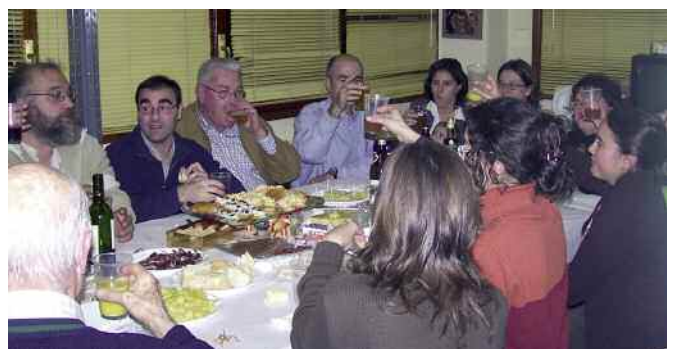
Encuentro de Navidad en Bilbao. ]