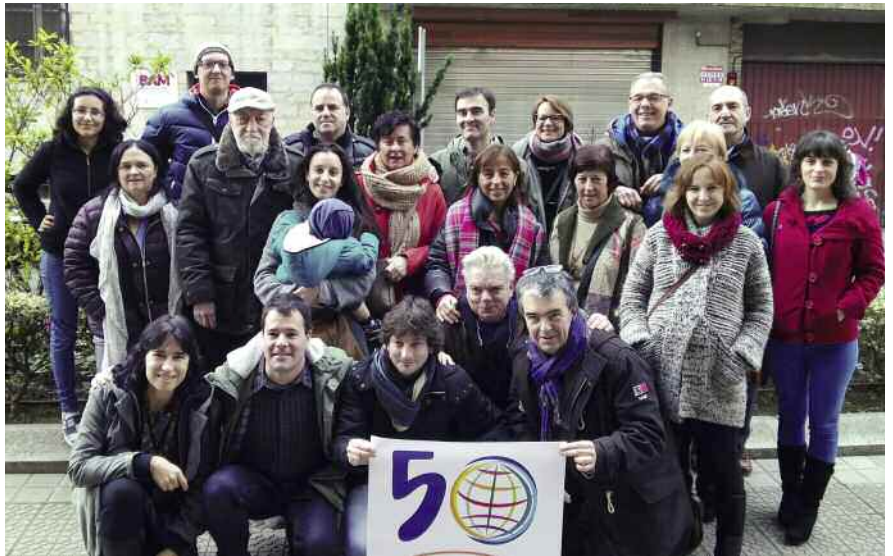
Reencuentro de medicusmundi bizkaia el 17 de enero de 2016. ]

Además, este año, con motivo del 50 aniversario de medicusmundi bizkaia , hemos querido celebrar la asamblea en sábado, de cara a lograr una mayor convocatoria y participación de todas las personas que habéis formado parte y continuáis siendo medicusmundi bizkaia . Por ello, tras la asamblea os proponemos continuar la jornada con una comida en Bilbao. Os facilitaremos más información a medida de que se acerque la fecha.