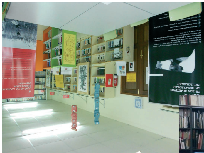
La exposición didáctica sobre los Objetivos de Desarrollo Sostenible se exhibe en diversos IES, acompañada de talleres formativos con el alumnado de Bachillerato y ESO. Imágenes de la exposición en el IES Víctor de la Concha de Villaviciosa

ciación de cara a la implantación de la agenda post-2015 recientemente aprobada, y al impulso de los Objetivos de Desarrollo Sostenible. Medicusmundi asturias no ha querido desaprovechar la ocasión de profundizar en esta temática, y para ello, y gracias a la financiación de la Agencia Asturiana de Cooperación al Desarrollo, impulsa diversas actividades que esperamos sean de vuestro interés. Para conocer más a fondo esta realidad, estamos tratando de promover un proceso de sensibilización sobre la necesidad del desarrollo de los países del Sur, impulsando el compromiso solidario necesario para favorecer el acceso universal a la salud y el desarrollo en el mundo. Además de las jornadas desarrolladas el pasado 7 de noviembre en el Auditorio, estamos difundiendo una serie de materiales divulgativos: exposición didáctica y guía informativa, y talleres formativos en los espacios que lo soliciten. Los Objetivos de Desarrollo Sostenible tienen vocación transformadora, y pretenden que nadie quede atrás ( no one must be left behind ). ¿Conseguiremos que no se queden solo en papel mojado?