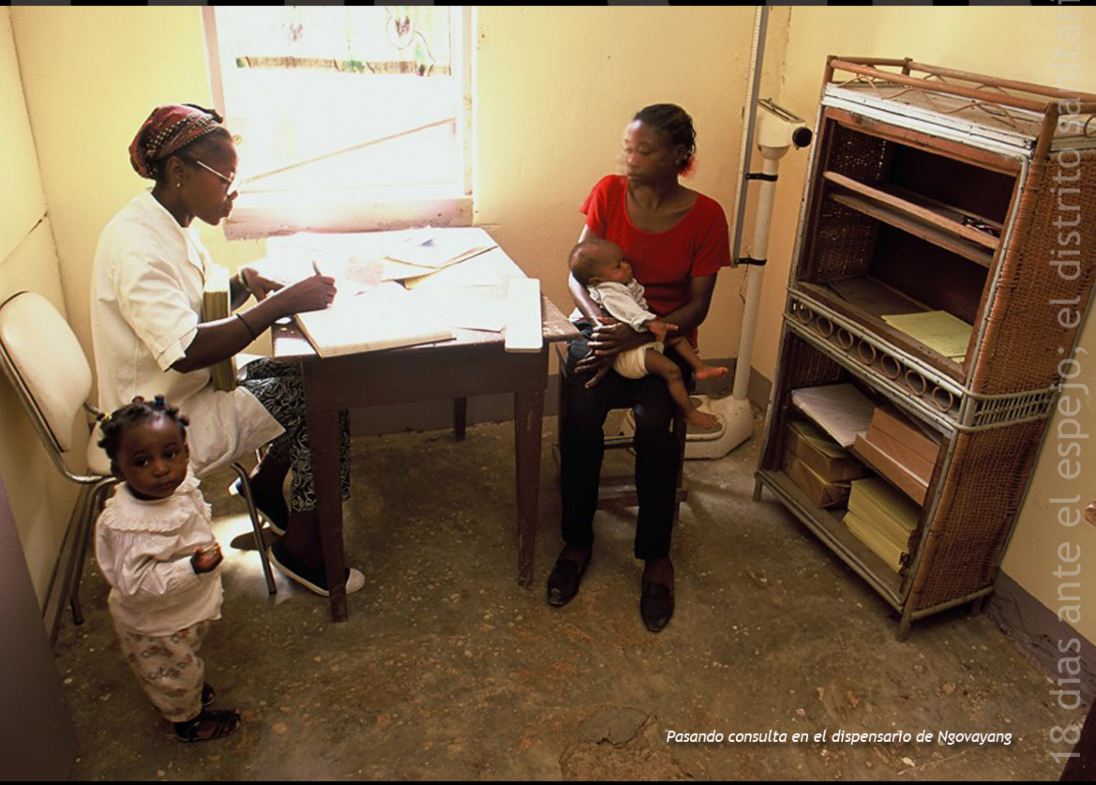
Pasando consulta en el dispensario de Ngovayang

La maxime « mieux vaut prévenir que guérir » trouve tout son sens à Lolodorf. Dans cette région la vaccination évite effectivement beaucoup de décès. Des morts peuvent être évités en rendant l'eau potable ou en participant à la lutte contre le SIDA... Ici plus qu'ailleurs, la prévention est une priorité. Dans ce contexte, la participation de la communauté devient aussi fondamentale qu'inéluctable. Sans une ferme conviction de la nécessité de cette participation, l'amélioration des conditions de vie et de santé des populations est très difficile, voir impossible.