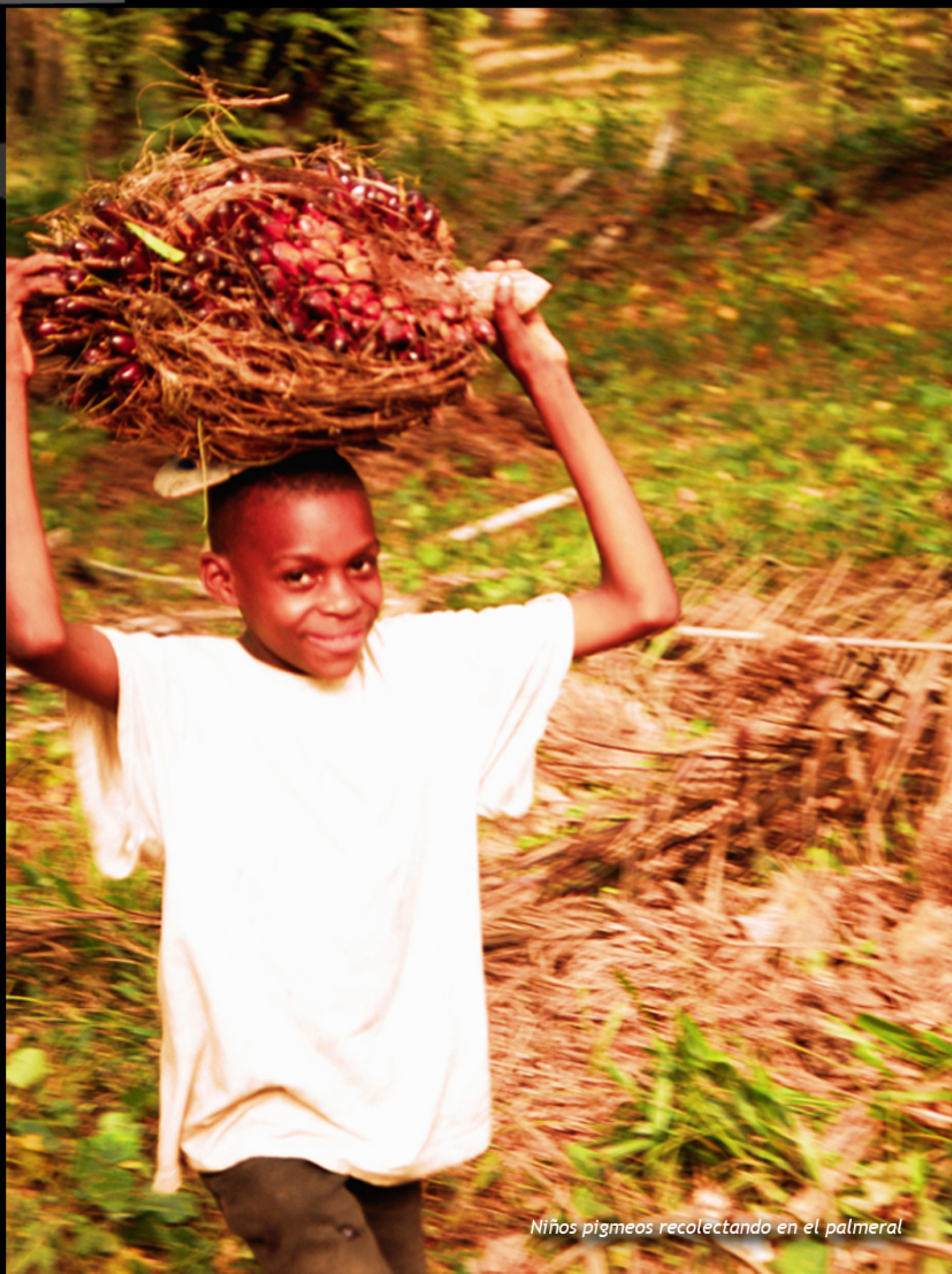
Niños pigmeos recolectando en el palmeral

L'une des causes principales du sous-développement sont les barrières que les pays du Nord dressent devant des produits venant des pays pauvres. La valeur du manque à gagner par ces derniers à cause du protectionnisme appliqué à leurs propres marchés par les pays riches, on l'estime à 100.000 millions de $US par an, soit le double du montant de l'aide mondiale au développement..