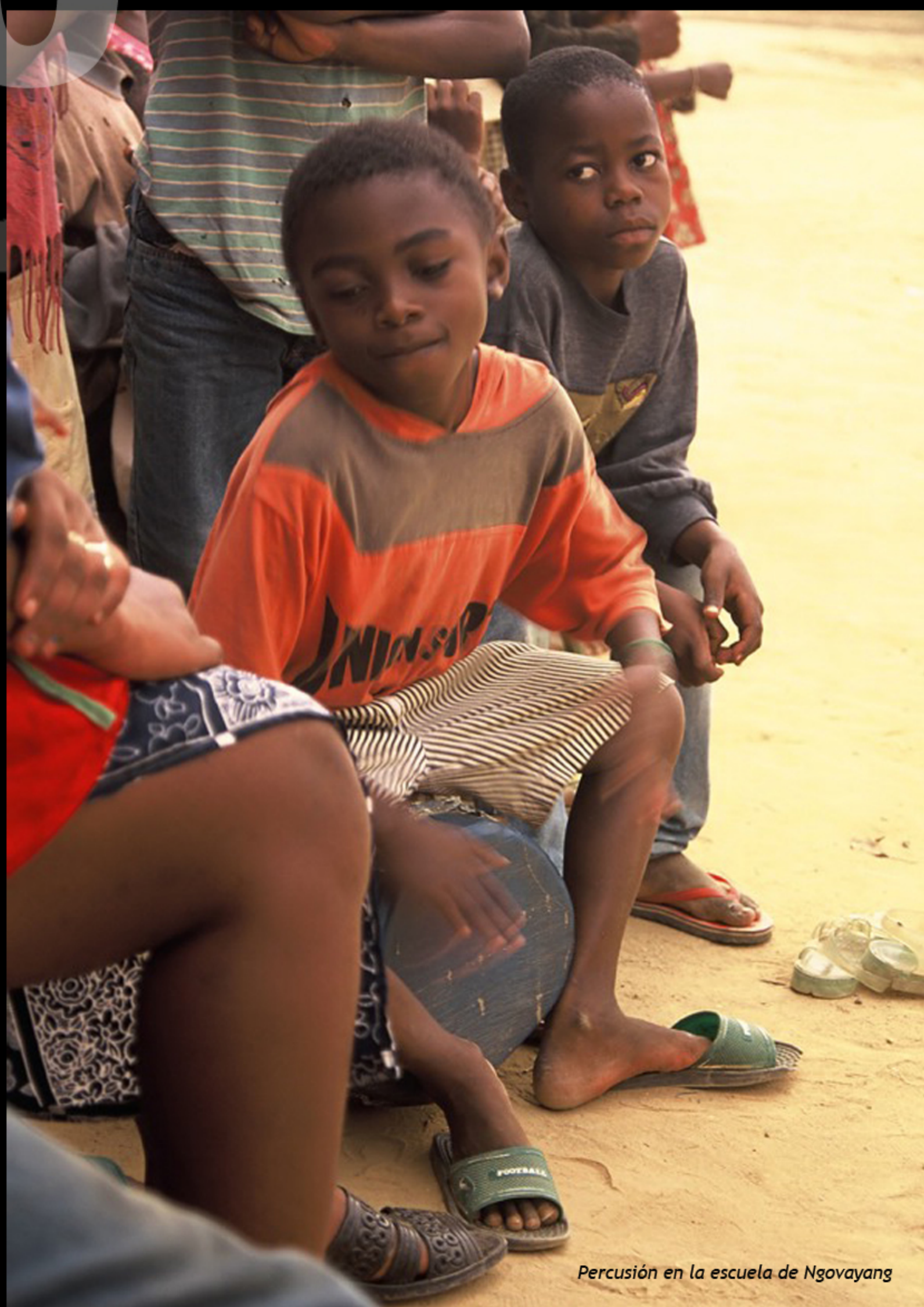
Percusión en la escuela de Ngovayang

L'imagination et l'ingéniosité sont présents dans la fabrication artisanale de jouets par les enfants, avec excellents résultats. La gestion est impeccable : utilisation de matériaux naturels ou de recyclage, donc pas de contamination du milieu ni besoin de piles pour les faire marcher, ni n'importe quelle autre sorte d'énergie. Les jeux ne seront ni violents ni compétitifs.