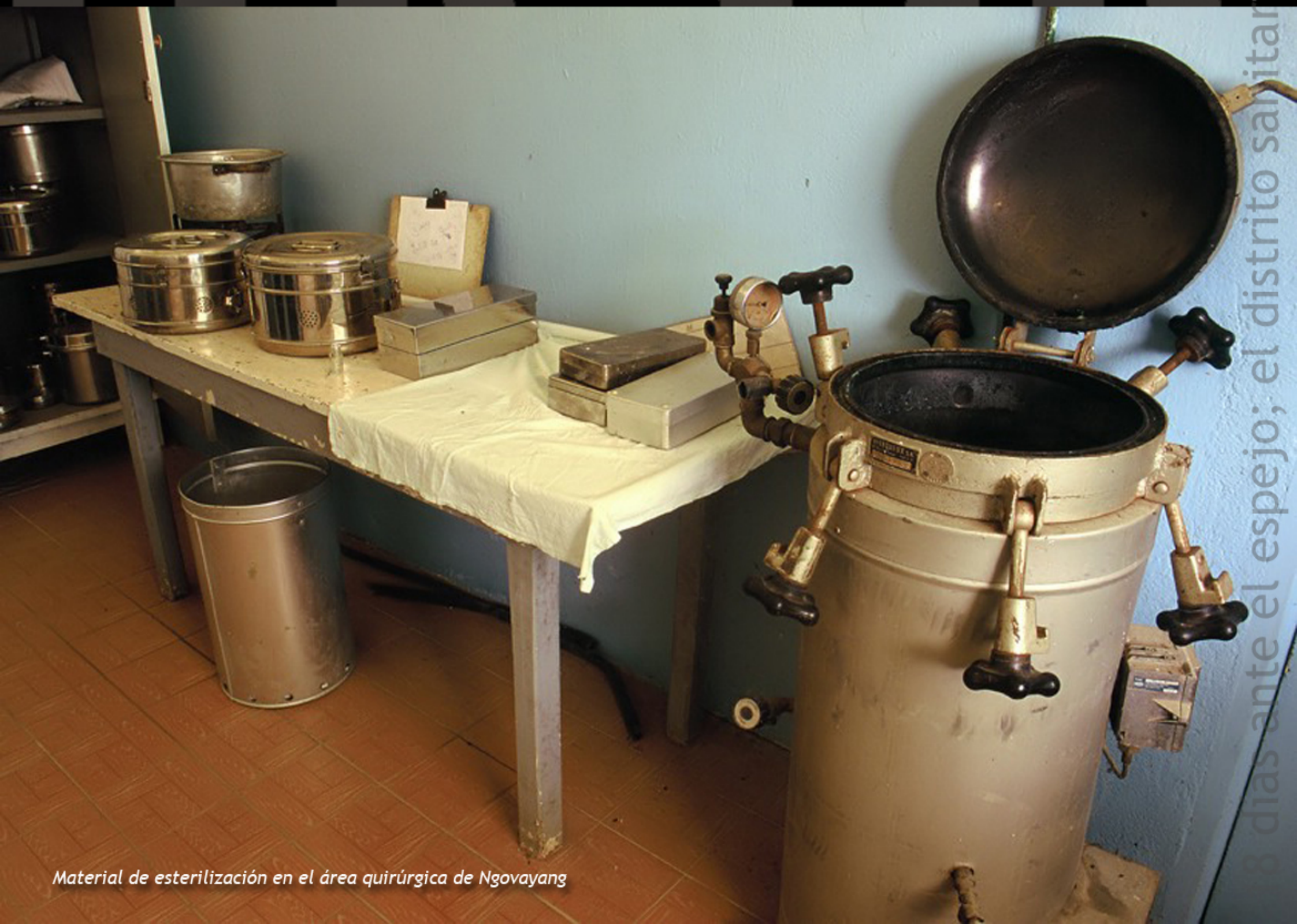
Material de esterilización en el área quirúrgica de Ngovayang

Les thérapeutes de Lolodorf n'ont pas cette facilité. Pour cette raison l'aide à l'équipement des formations sanitaires est absolument nécessaire pour la bonne exécution de leur travail. Bien que ce personnel ait une grande capacité pour s'adapter à la pénurie de moyens, il est de justice qu'il puisse disposer d'un minimum d'équipement moderne pour réaliser leur travail quotidien dans de meilleures conditions.