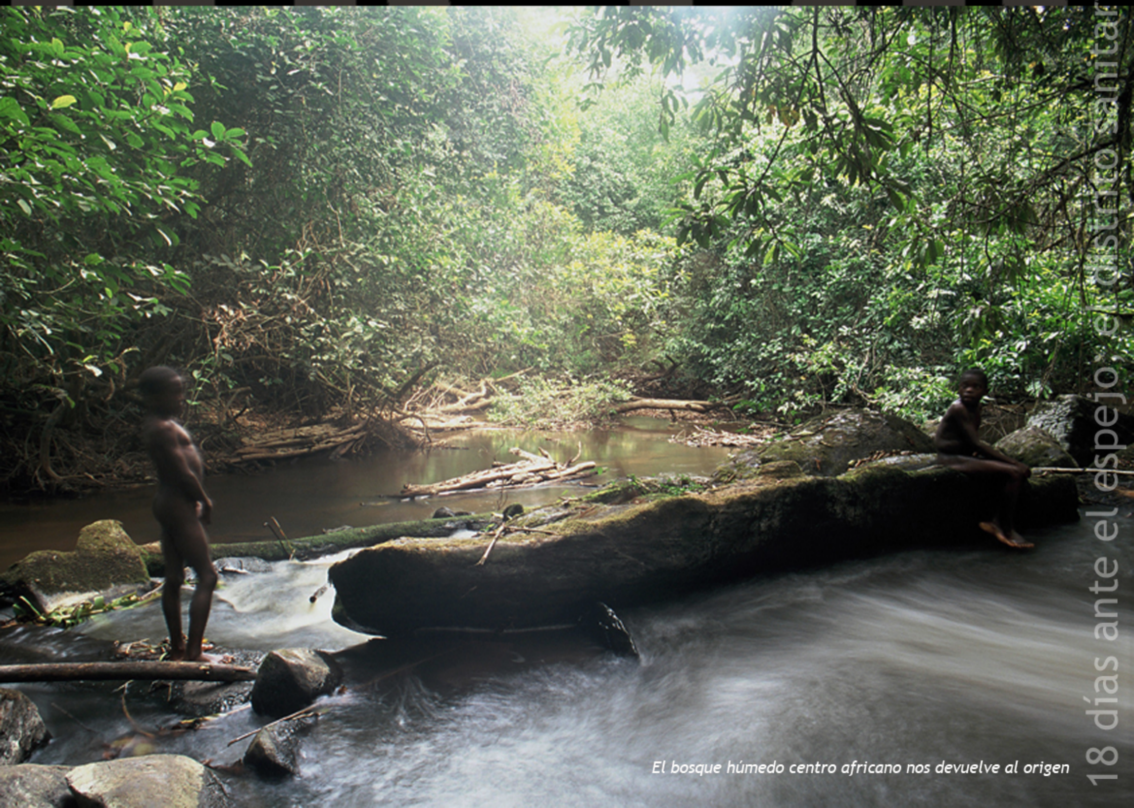
El bosque húmedo centro africano nos devuelve al origen

L'immensité et la beauté de la forêt camerounaise nous offrent un espace à la fois ouvert et dense. La nature sauvage nous offre gracieusement, un lieu plein de splendeur et une thérapie naturelle à la portée de tous. La forêt est une source de santé. L'occupation de cet espace est simple : D'une part les pistes en terre au bord desquelles se situent les maisons d'habitation et d'autre part, comme toile de fond, l'immense bois fait d'arbres géants et de végétation exubérante.