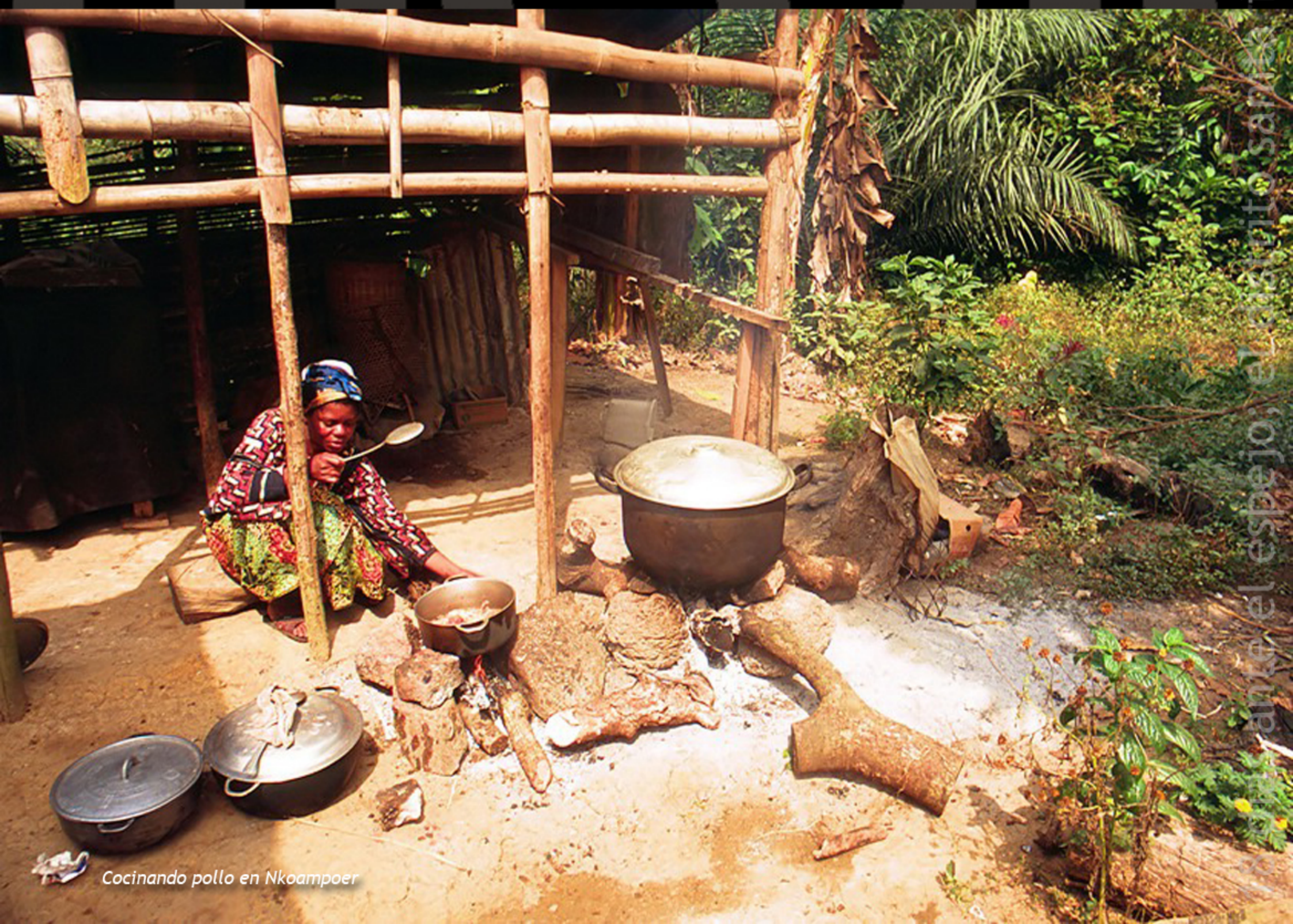
Cocinando pollo en Nkoampoer

Le foyer, pratiquement situé à l'aire libre, bénéficie des éléments présents dans la nature. Ainsi, les pierres, le bois et le feu, servent à la cuisson des aliments que donne la terre chaque jour de chaque saison. Il s'agit d'une nourriture saine qui se prépare avec patience, tranquillement, sans être pressé. Au moment de la manger, son assimilation semble être favorisée par cette absence de stress au moment de son élaboration.