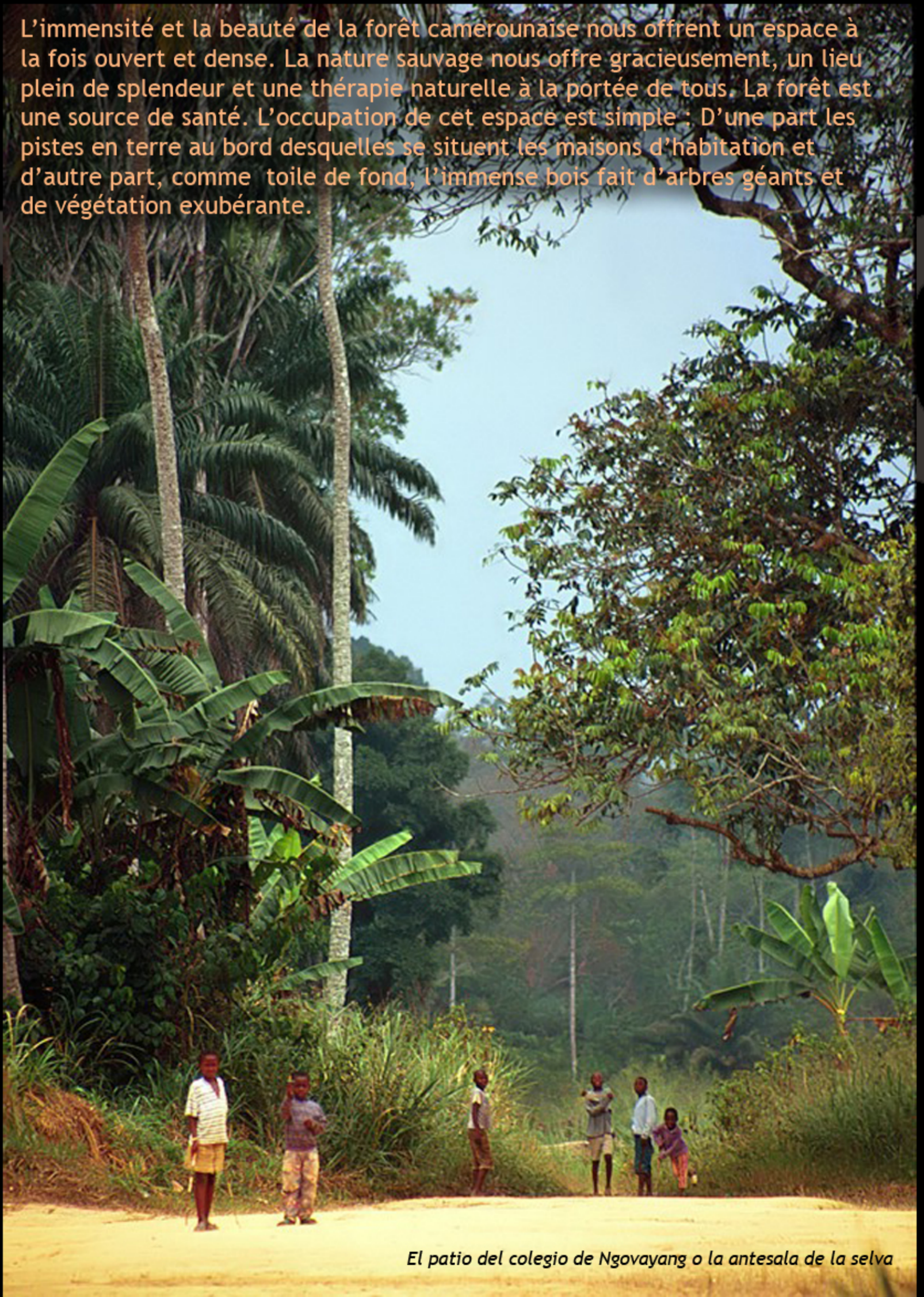
El patio del colegio de Ngovayang o la antesala de la selva

L'immensité et la beauté de la forêt camerounaise nous offrent un espace à la fois ouvert et dense. La nature sauvage nous offre gracieusement, un lieu plein de splendeur et une thérapie naturelle à la portée de tous. La forêt est une source de santé. L'occupation de cet espace est simple : D'une part les pistes en terre au bord desquelles se situent les maisons d'habitation et d'autre part, comme toile de fond, l'immense bois fait d'arbres géants et de végétation exubérante.