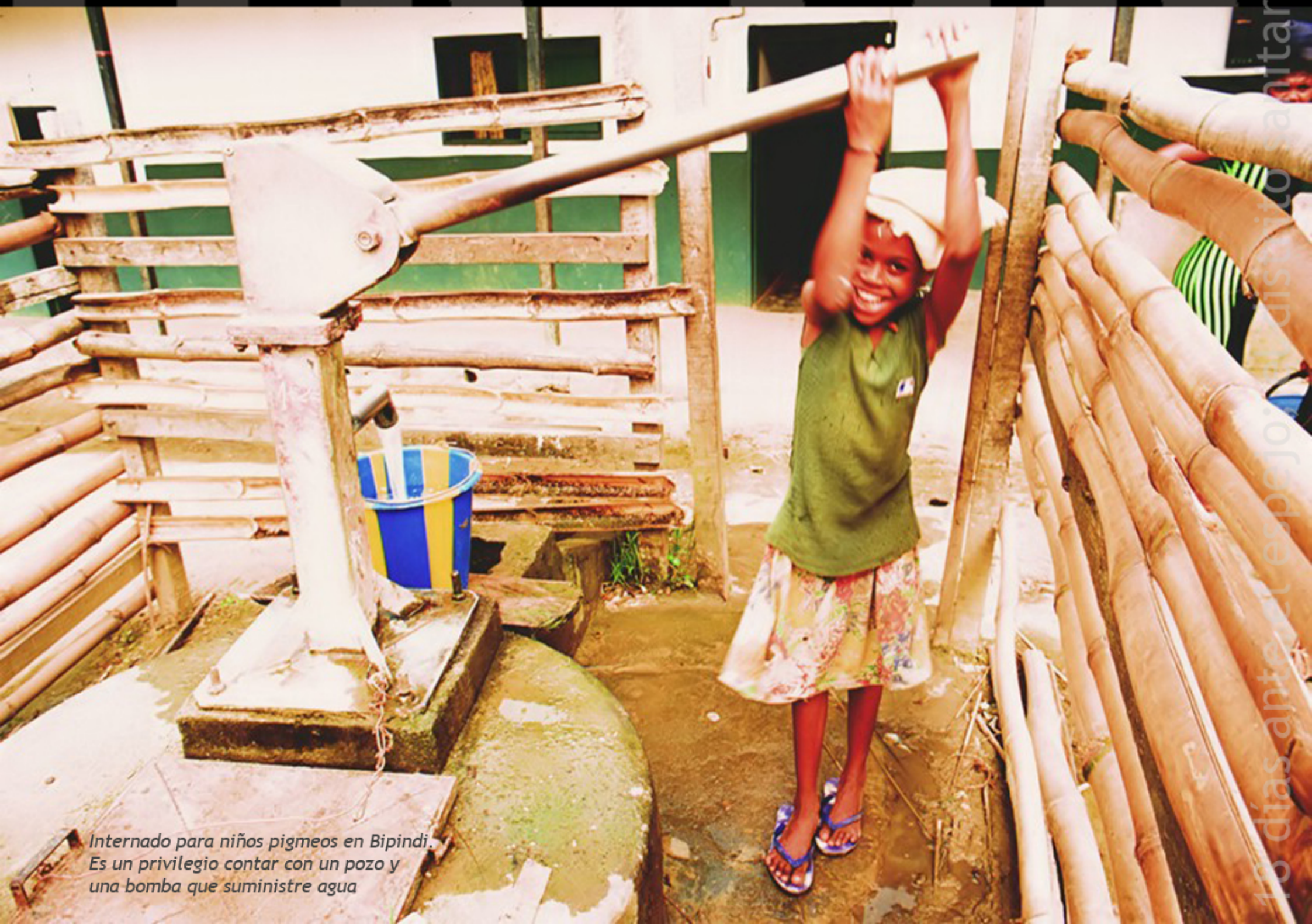
Internado para niños pigmeos en Bipindi. Es un privilegio contar con un pozo y una bomba que suministre agua

La première des priorités est la recherche de la nourriture journalière. La pêche est, en même temps, un bon moment pour s'amuser, pour travailler et pour partager les aliments avec les amis. Tandis que l'on marche calmement vers le fleuve et que l'on attend tranquillement attraper quelque chose, il n'y a pas de place pour l'angoisse. C'est tout simplement une fête.