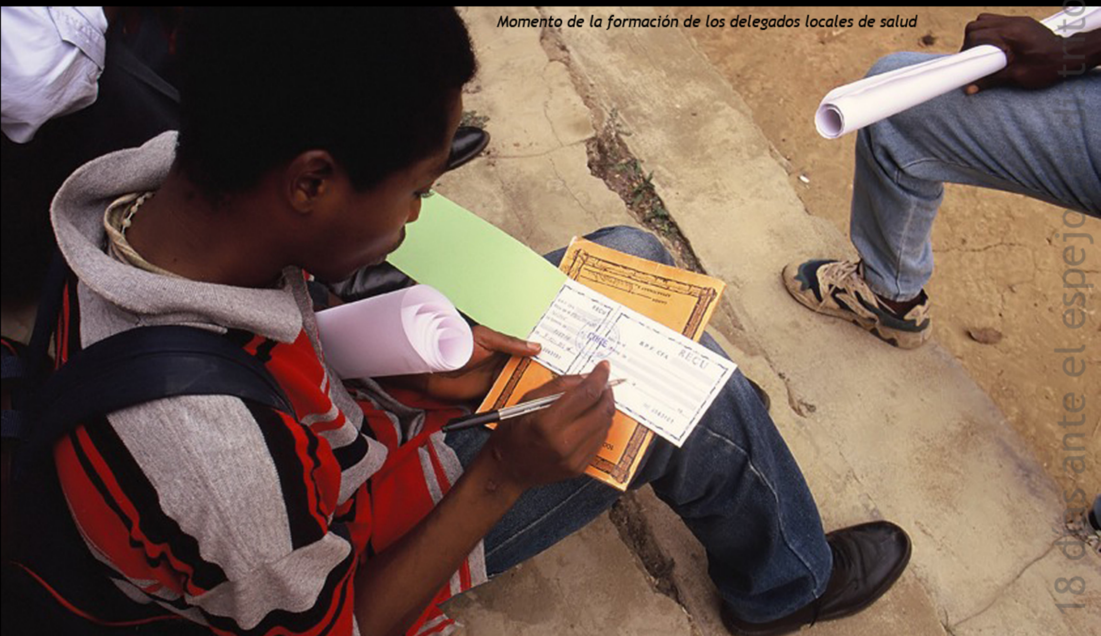
Momento de la formación de los delegados locales de salud

Dans notre milieu, la préparation de professionnels désirant utiliser leurs connaissances et leur savoir-faire dans d'autres horizons culturels, comporte un réveil des consciences et une ouverture des mentalités afin d'éliminer des attitudes arrogantes et des sentiments de supériorité éventuels. D'habitude, nous souhaitons aider les autres sans réfléchir sur ce que les autres vont nous donner. Nous croyons être mieux préparés mais nous oublions que sans les autres nous pouvons rien faire. Il nous est surtout difficile reconnaître que notre façon de voir les choses n'est pas toujours celle des autres.