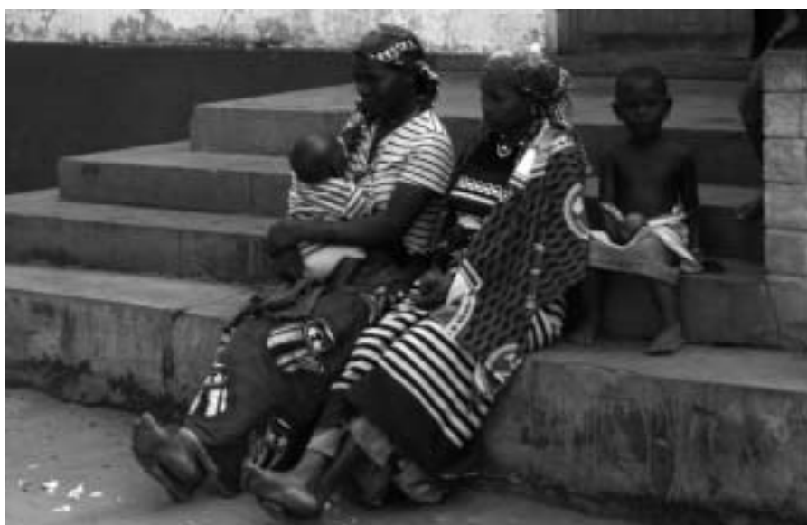
Pacientes en el centro de salud de Chai (Mozambique). Fran Vega

En la Comunidad de Madrid el porcentaje destinado a ayuda al desarrollo es del 0,17%, muy lejos del 0,7% reclamado