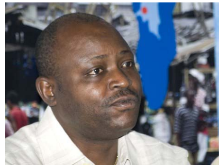
República Democrática del Congo