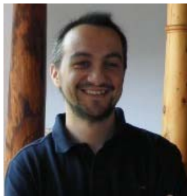
Coordinador Cooperación y Acción Humanitaria