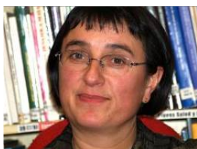
Responsable Unidad África