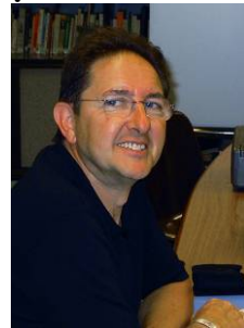
Logística y Mantenimiento