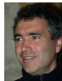
Coordinador Educación y Sensibilización