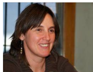
Coordinadora Base Social, Incidencia y Redes