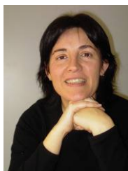
Responsable de Calidad y Técnica de Proyectos