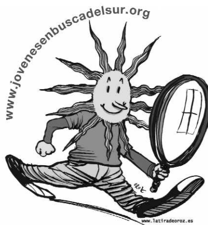
Imagen del concurso en la sexta edición celebrada en Navarra.

El Ayuntamiento de Madrid apoyará esta iniciativa con 38.317 euros.