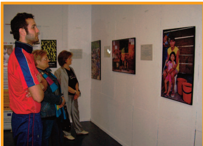
Una exposición fotográfica muestra los efectos de la Malaria en la poblaciones

Por estos motivos, la campaña Stop malaria now! quiere dar a conocer esta enfermedad y sus consecuencias en Europa, y conseguir un compromiso político, económico y social para erradicar este mal endémico que azota a los países más empobrecidos.