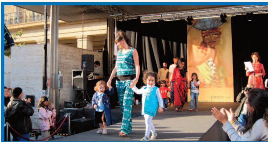
Los modelos 'solidarios' llevaban complementos de la tienda de medicusmundiaragón .

Una iniciativa que, sin duda, cada año cuenta con más éxito de participación entre los zaragozanos.