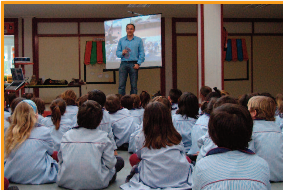
Los niños de África construyen sus propios juguetes con materiales reciclados

Una jornada que, sin duda, les sacó de su rutina habitual y les acercó a una cultura nueva, rica en tradiciones, y con muchas cosas que enseñar.