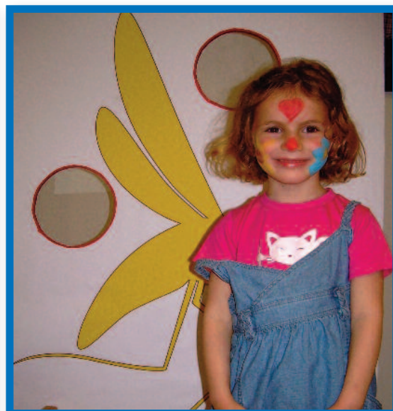
Los niños aprendieron como acabar con la mosquita anopheles