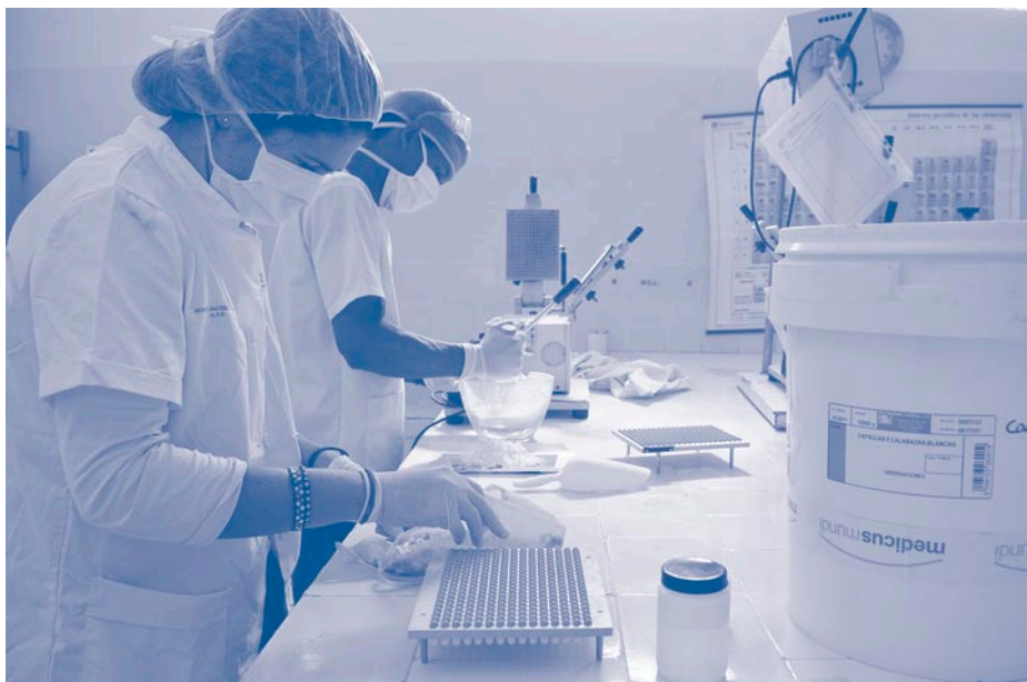
Omplert de càpsules