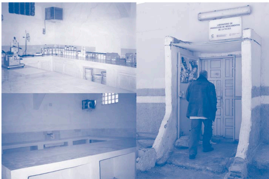
Adequació de la zona de producció