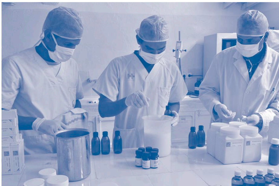
Tècnics del laboratori a la zona de producció

breta de notes amb fórmules magistrals d'aquella època, que de tant en tant consultava. Aquí va ser quan va néixer realment el projecte d'elaboració de medicaments de la República Àrab Sahrauí Democràtica (RASD) . Per què no produir medicaments essencials en els mateixos campaments? Es mitigaria, encara que fos mínimament, la dependència de l'ajuda exterior, a la vegada que es motivaria a la població sahrauí i als seus professionals, persones ben formades en països com Cuba, Rússia, Algèria i Líbia, però sense possibilitats de desenvolupar les seves carreres professionals als campaments.