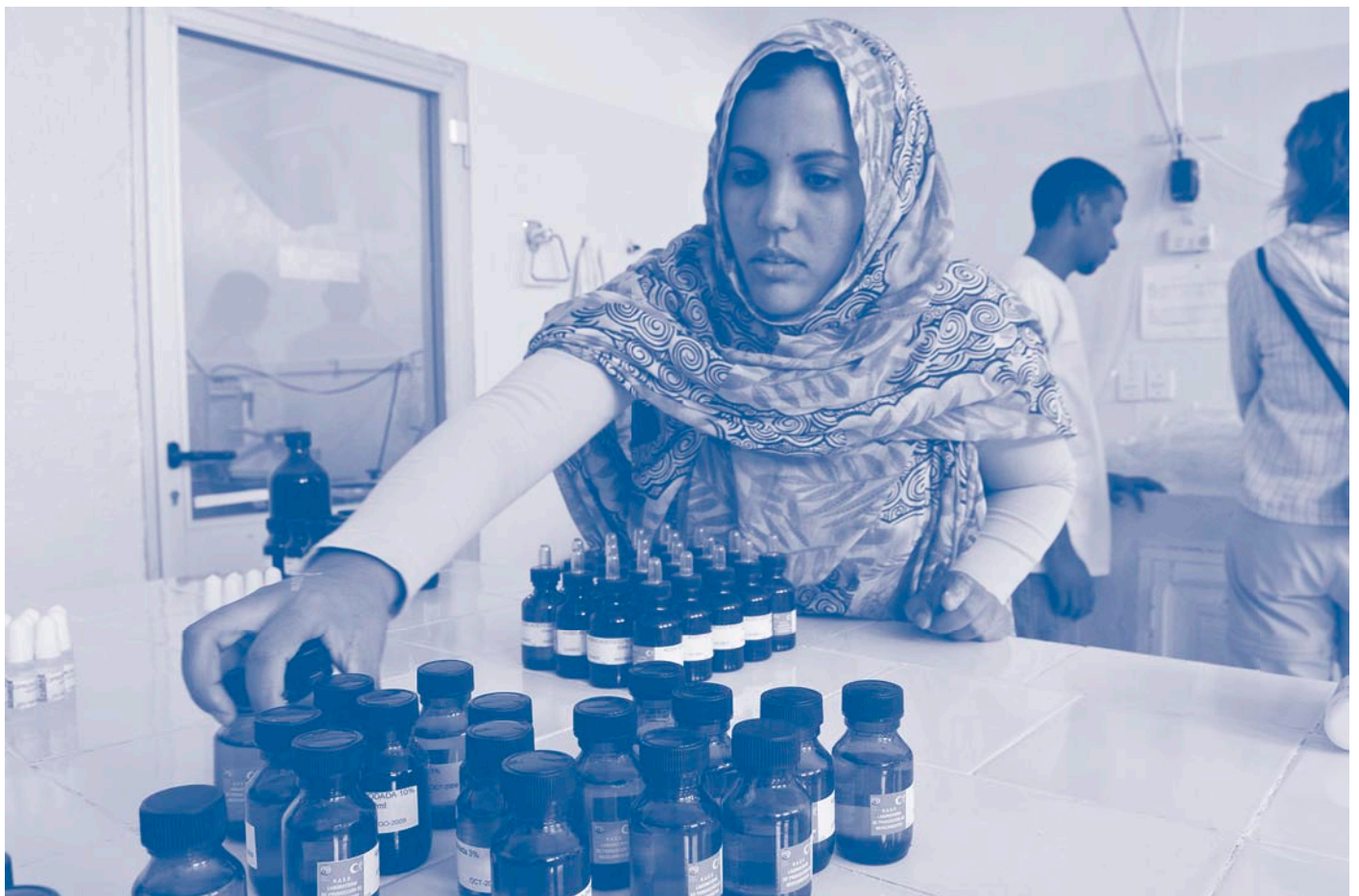
Treballadora del laboratori etiquetant xarops

Durant aquest primer viatge de prospecció es va observar com un auxiliar de farmàcia estava preparant, amb els pocs mitjans de què disposava, unes solucions antisèptiques. En preguntar-li pel seu treball ens va explicar que havia treballat en una farmàcia de l'antiga colònia espanyola i que conservava una lli-